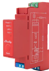
Shelly Pro 1PM