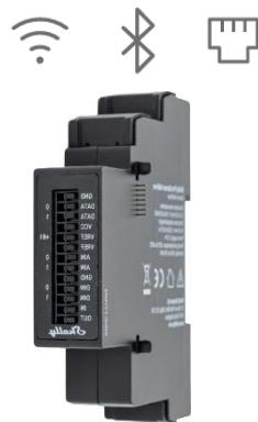
Shelly Pro Sensor Add-on