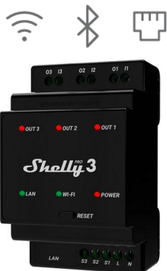
Shelly Pro 3