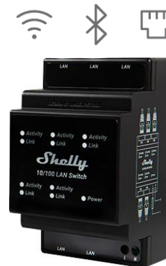
Shelly LAN Switch