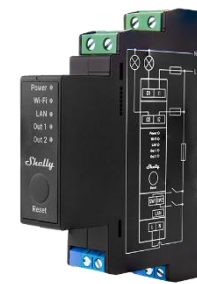
Shelly Pro 2PM