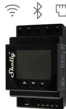
Shelly Pro 4PM