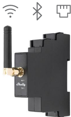
Shelly Pro LoRa Add-on