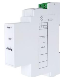
Shelly Pro 3EM Switch Add-on