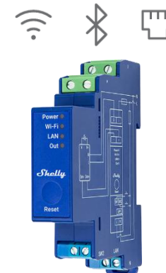
Shelly Pro RGBWW PM Shelly Pro Dimmer 1PM Shelly Pro Dimmer 2PM Shelly Pro Dimmer 0/1-10V PM