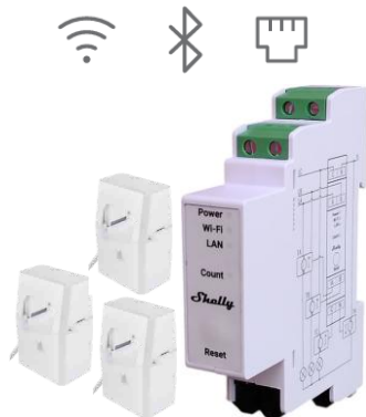
Shelly Pro 3EM 400A