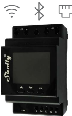
Shelly Pro Dual Cover PM