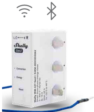
Shelly 3EM-63T Gen3