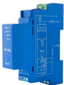
Shelly Pro 1