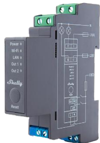
Shelly Pro 2