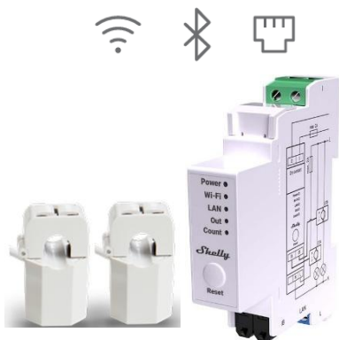
Shelly PRO EM - 50