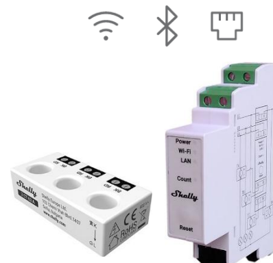
Shelly Pro 3EM-3CT63